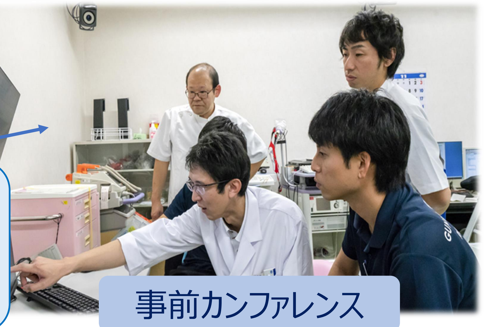
事前カンファレンス

リハビリテーション部医師と理学療法士で、電子カルテから患者さんの情報を得て、リハビリの適応などを見極めていきます。また、実際にICUのベッドサイドで患者さんの様子を観察し、リハビリの内容を検討したりします。